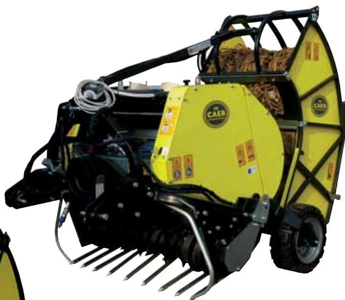
QUICKPOWER 1230 + Zásobník 4CM