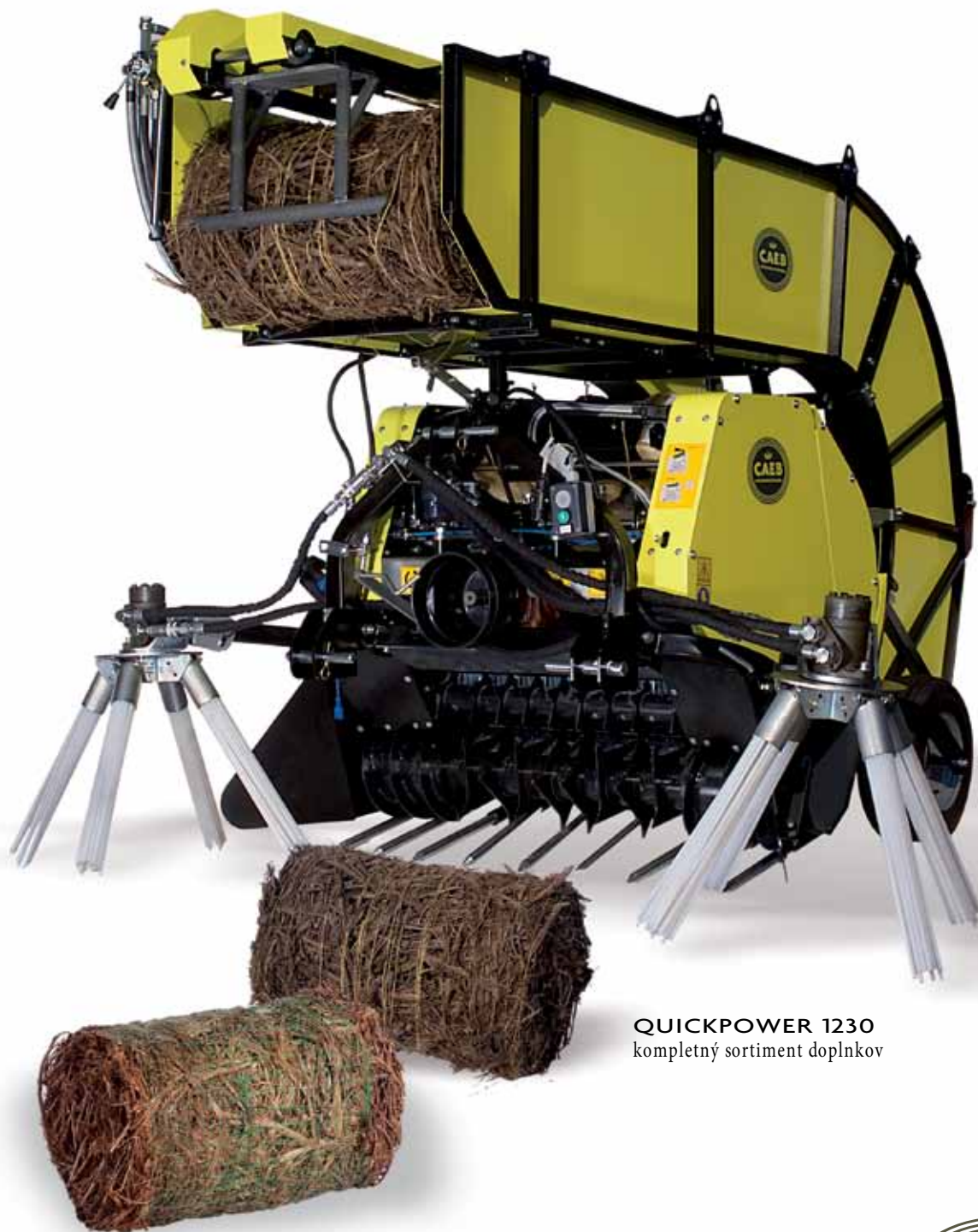
QUICKPOWER 1230 kompletný sortiment doplnkov